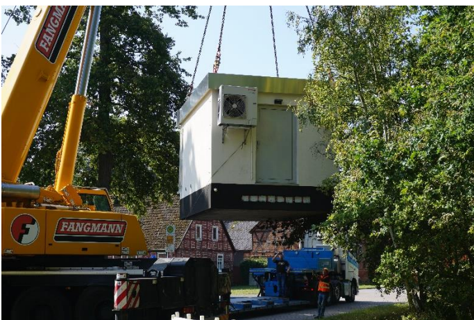
PoP-Aufstellung in Zehren

Im Bauabschnitt 2 des Projektgebietes 2 werden ca. 1.915 absolut ländliche Glasfaseranschlüsse realisiert. Das ausführende Tiefbauunternehmen ist die Aytac Bau GmbH.